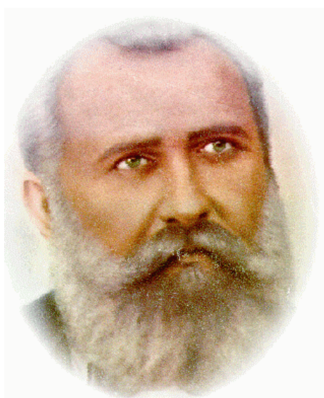
Bezerra de Menezes

A Doutrina Espírita como Filosofia Teogônica